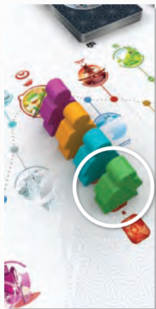
O Viajante Verde será o primeiro a sair da Estalagem.

Quando o primeiro Viajante chega à Estalagem, ele compra um número de cartas de Refeição igual ao número de jogadores mais 1. (Por exemplo, numa partida de 3 jogadores, ele compra 4 cartas.)